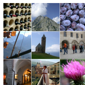
Brixen / Südtirol Hotel Goldene Krone