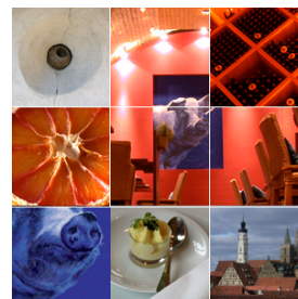
Rothenburg ob der Tauber Hotel Mittermeier