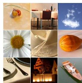
Leipheim / Ulm Restaurant im Zehntstadel